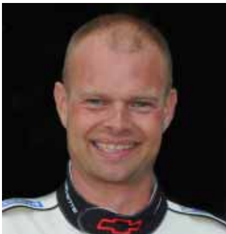
Jan Magnussen