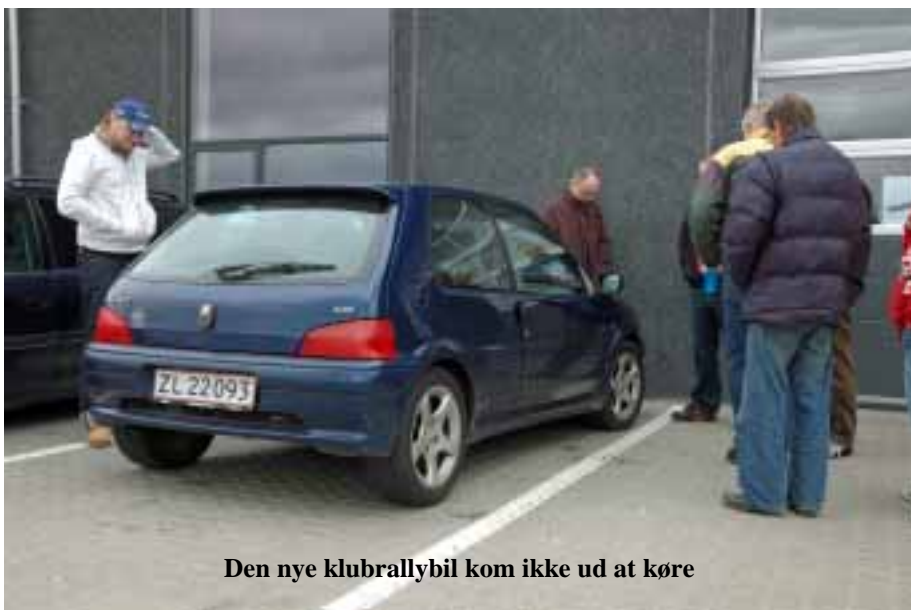
Den nye klubrallybil kom ikke ud at køre