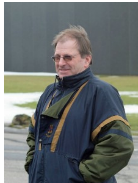
Bernd havde også tid til at kigge på deltagerne