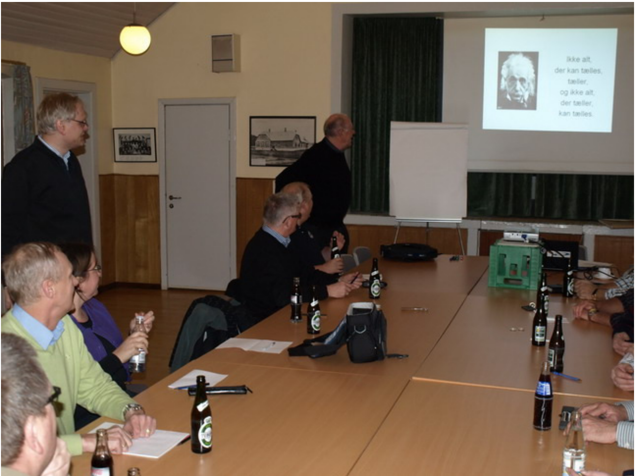
Tekst og foto: Bjarne Andersen.