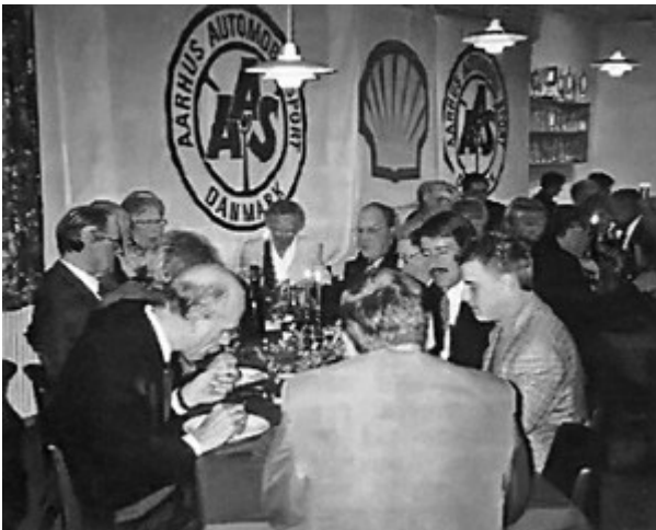
40 års jubilæum - her nyder unge og gamle medlemmer.