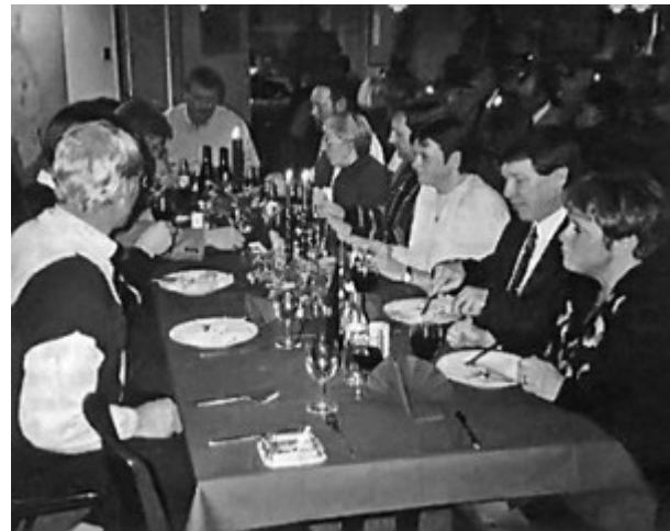
40 års jubilæum - mon kassereren er klar med pungen.